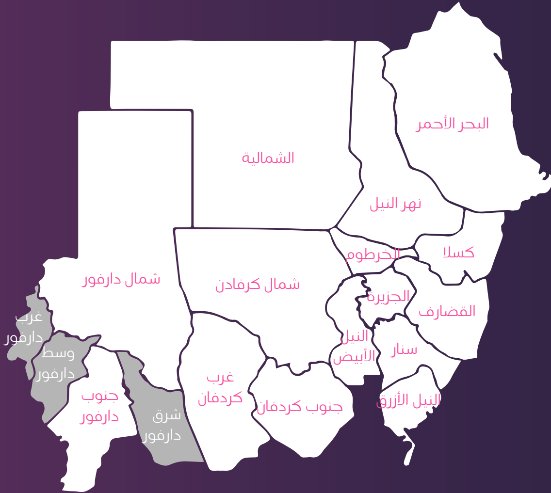
■ وصولنا في ولايات السودان